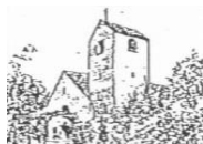
St. Marien Kirche Rastede Eichendorffstr. 6