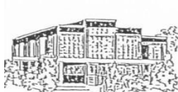
St. Marien Kirche Bad Zwischenahn Auf dem Hohen Ufer 15