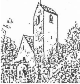
St. Marien Kirche Rastede