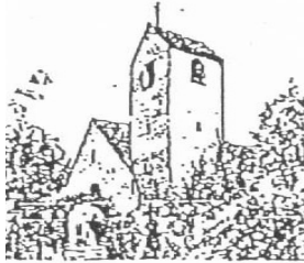
St. Marien Kirche Rastede

Auf dem Hohen Ufer 17, 26160 Bad Zwischenahn Tel. 04403/623040 - Fax 04403/623041 – E-Mail: pfarrbuero@st-pallotti.de